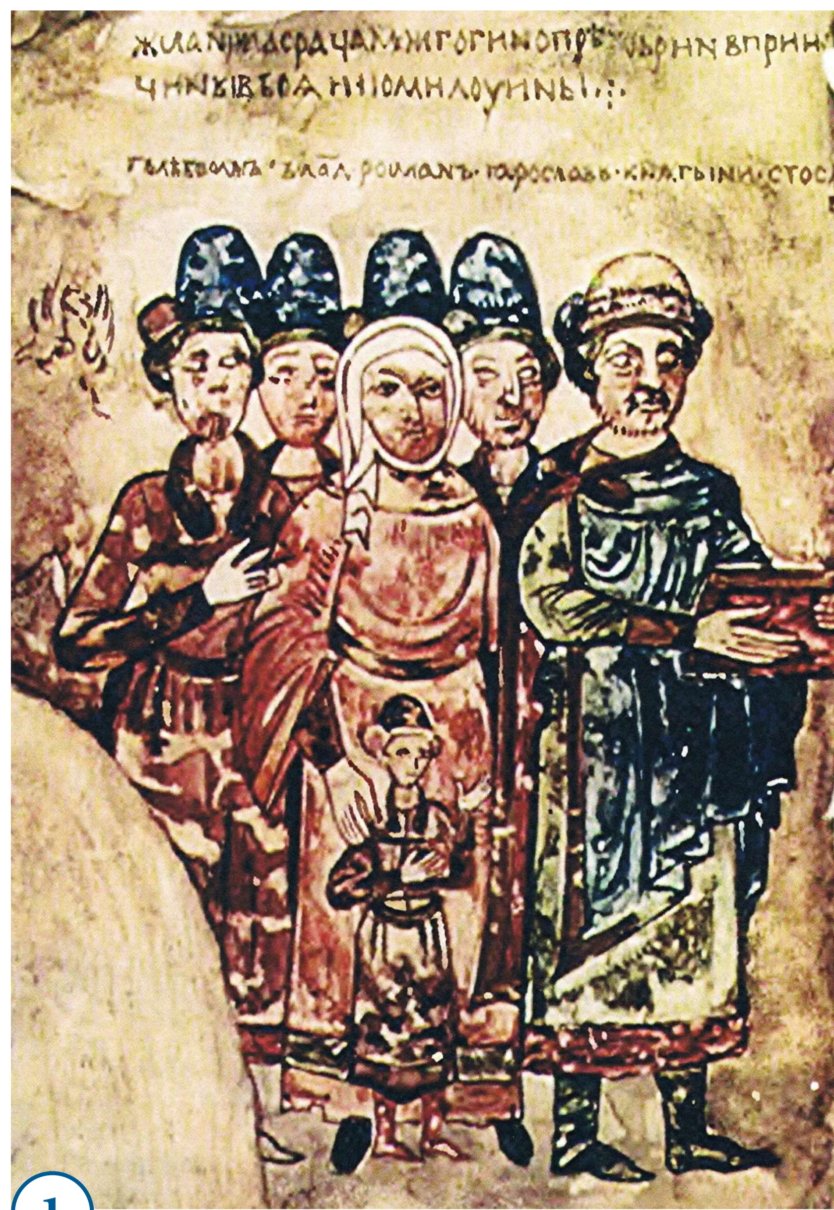
1. Родина князя Святослава (зліва: дружина Ода Штаденська та їх малолітній син Ярослав). Мініатюра, 1073 Familie des Fürsten Swjatoslaw (von links: Ehefrau Oda von Stade und ihr minderjähriger Sohn Jaroslaw). Miniatur, 1073

Київська держава не була ізольована від католицького Заходу, а була залучена до військово-політичних, церковних, династичних, торговельних зв'язків із романо-германським світом. Співкування із представниками західного християнства почалося ще до хрещення Русі. Першим католицьким священником, який побував на Русі, став саксонець, монах з Тріра Адальберт (пізніше – єпископ Магдебурзький). На прохання княгині Ольги він відвідав Київ (961–962) для проповідування християнства. Але його місія успіху не мала. За правління київського князя Ярополка I Святославича (972–978), яке було відзначене дипломатичними контактами з германським імператором Оттоном II, діяльність німецьких місіонерів пошлася. І після прийняття християнства (988) Київська Русь підтримувала контакти із представниками католицької церкви. Князь Володимир приймав у Києві (1007) саксонця Бруно Кверфуртського, єпископа-місіонера, який відправився на вертати до християнства печенігів. Його послання імператору Генріху II (1007) – унікальне джерело з історії Київської Русі та єдине повідомлення сучасника про Володимира Великого. За Ярослава Мудрого у столиці виникла католицька громада, членами якої були і німці. Київ підтримував торговельні зв'язки з Аугсбургом, Бреслау, Регенсбургом.