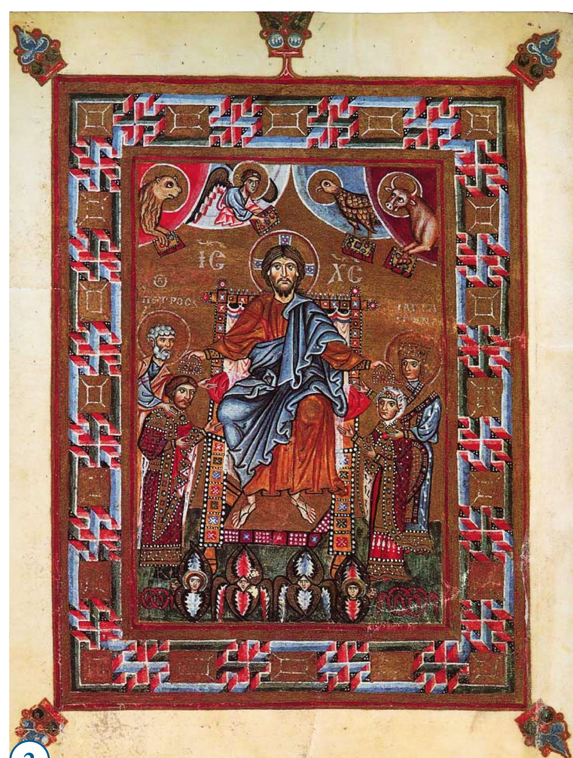
2. Христос коронує князя Ярополка та його дружину княгиню Ірину (Кунігунда Орламюндська). Мініатюра, кінець XI ст. Національний музей археології, Чивідале, Італія Christus krönt den Fürsten Jaropolk und Irina (Kunigunde von Orlamünde). Miniature, Ende 11. Jh. Archäologisches Nationalmuseum, Cividale, Italien

Der Kiewer Staat war in militärisch-politische, kirchliche, dynastische und Handelsbeziehungen mit dem Abendland eingebunden und der Austausch mit Vertretern der Christenheit des lateinischen Ritus begann schon vor der Taufe der Rus'. Als erster katholischer Geistlicher weilte in der Rus' ein Sachse, der Trierer Mönch Adalbert (später: Bischof von Magdeburg). Auf Ersuchen der Fürstin Olga kam er nach Kiew (961–962) um das römische Christentum zu verkünden. Seine Mission blieb ohne Erfolg. In die Regierungszeit des Kiewer Fürsten Jaropolk I. Swjatoslawitsch (972–978) fielen diplomatische Kontakte mit dem Kaiser des Heiligen Römischen Reiches Otto II. und eine Belebung der Tätigkeit deutscher Missionare. Die Kiewer Rus' unterhielt auch nach der Taufe (988) Kontakte mit Vertretern der römischen Kirche. Fürst Wladimir empfing in Kiew 1007 den Sachsen Brun von Querfurt, einen Missionsbischof, der zwecks Mission zu den Petschenegen ging. Brunos Bericht an Kaiser Heinrich II. ist eine einzigartige Quelle über die Geschichte der Kiewer Rus' und die einzige Überlieferung eines Zeitgenossen über Wladimir den Großen. Unter Jaroslaw dem Weisen entstand in der Hauptstadt eine römisch-christliche Gemeinde, zu deren Gliedern auch Deutsche gehörten. Kiew unterhielt Handelsbeziehungen mit Augsburg, Breslau und Regensburg.