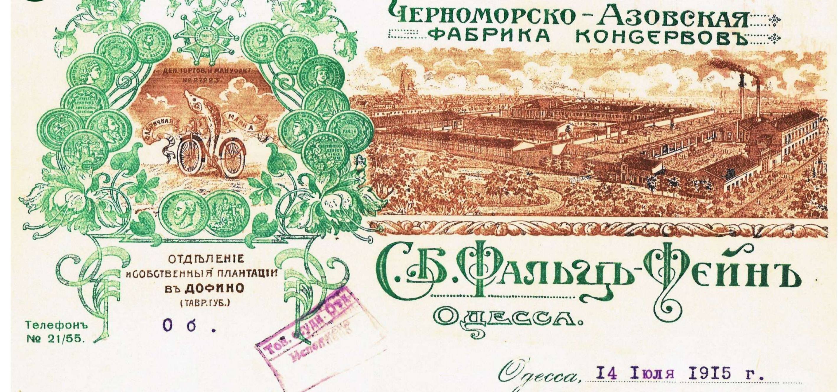
3. Реклама Чорноморсько-Азовської фабрики консервів Софії Фальц-Фейн в Одесі і Дофіно. 1915