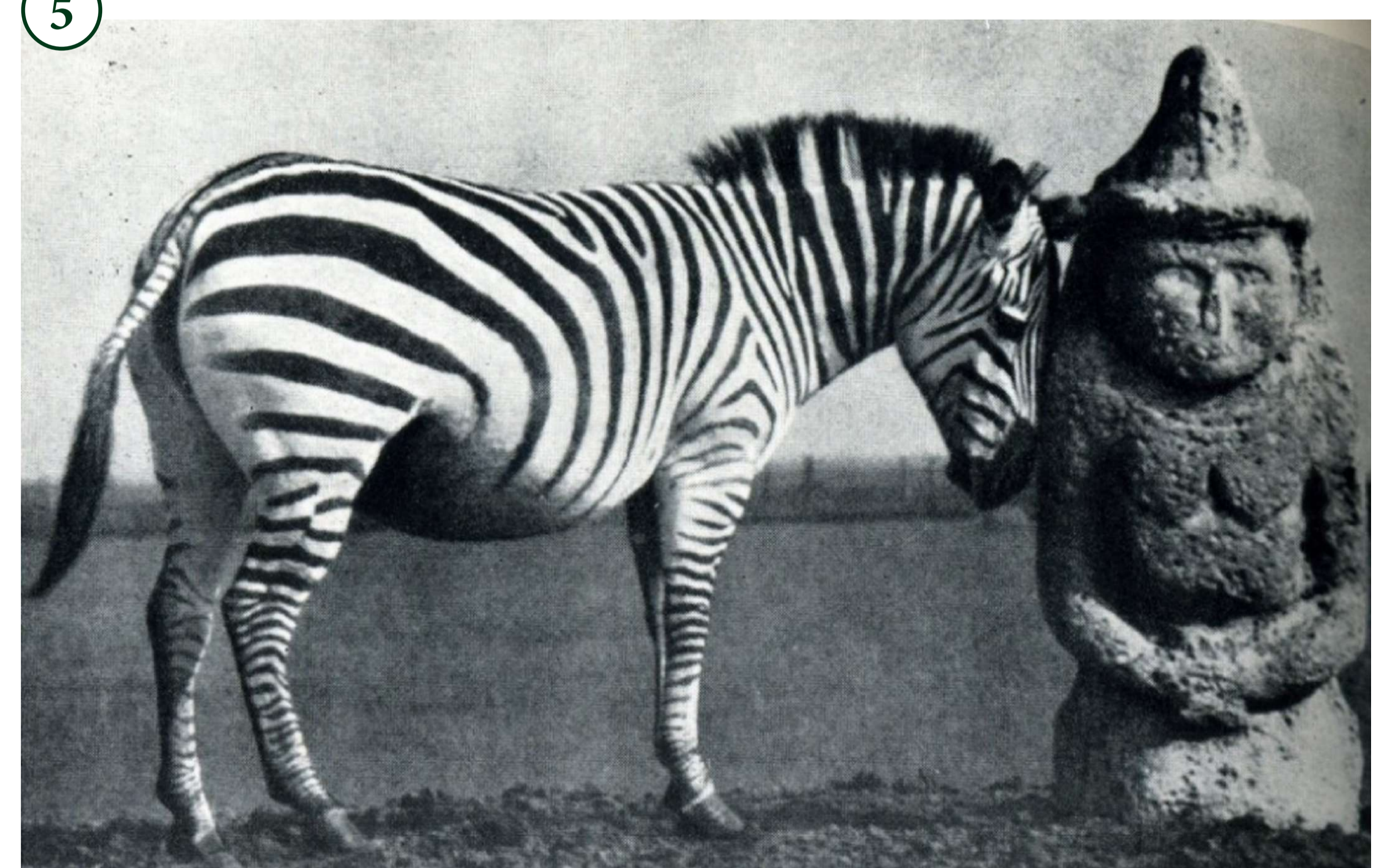
5. Асканія-Нова. Початок XX ст. Askania Nova. Anfang 20. Jh.