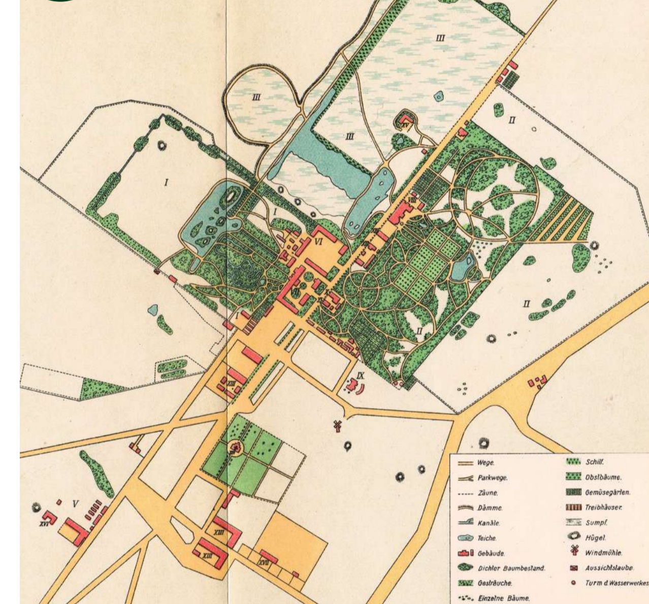
6. План Асканії-Нової. 1920 Plan von Askania Nova. 1920