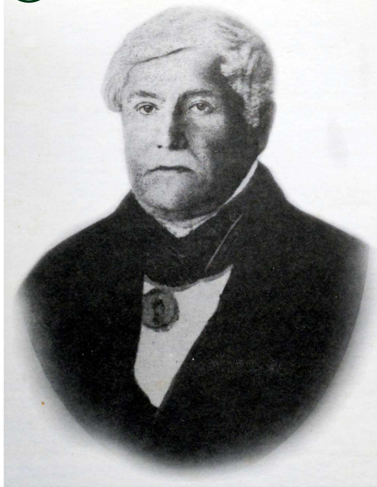
1. «Король вівчарства» Фрідріх Фейн (1794–1864)