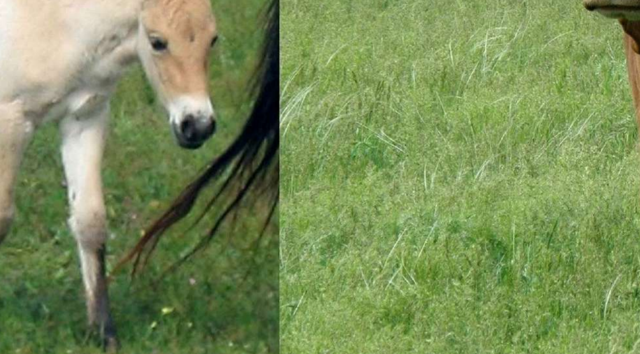
9. Мешканці заповідника Bewohner des Naturschutzgebiets