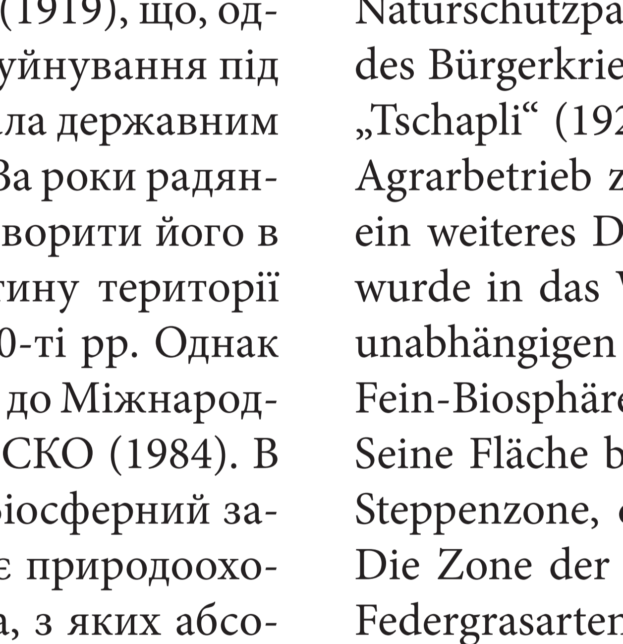
4. Nach der Revolution hat man das nationalisierte Askania Nova zu einem volkseigenen Naturschutzpakt erklärt (1919), was es jedoch nicht vor Plünderung und Zerstörung während des Bürgerkrieges bewahrte. Dann wurde es zu einem staatlichen Steppen-Naturschutzgebiet „Tschapl“ (1921). In den Jahren der Sowjetmacht versuchte man es zu einem gewöhnlichen Agrarbetrieb zu machen: ein Drittel des Geländes wurde in den 1920er Jahren umgepflügt, ein weiteres Drittel in den 1960er Jahren. Das Naturschutzgebiet blieb jedoch erhalten und wurde in das Weltnetz der Biosphärenreservate der UNESCO aufgenommen (1984). In der unabhängigen Ukraine bekam es den Namen seines Gründers (1994). Heute ist das F. E. Falz-Fein-Biosphärenreservat im Gebiet Cherson ein Naturschutz- und Forschungskomplex. Seine Fläche beträgt mehr als 33 Tausend ha, von denen die ausschließlich naturschutzgelagerte Steppenzone, die nie von einem Pflug berührt wurde, mehr als 11 Tausend ha einnimmt. Die Zone der anthropogenen Landschaften umfasst mehr als 15 Tausend ha. Verschiedene Federgrasarten machen 70 % der Vegetation aus. In der Steppe weiden Saigaantilopen, Büffel, Antilopen, Watussi-Rinder, Zebras, Przewalski-Pferde, Wisente, Hirsche. Eine wunderbare Ansicht, als ob die biblische Erscheinung von der Anlandung der Bewohner der Arche Noah in der ukrainischen Steppe aufgelebt wäre...