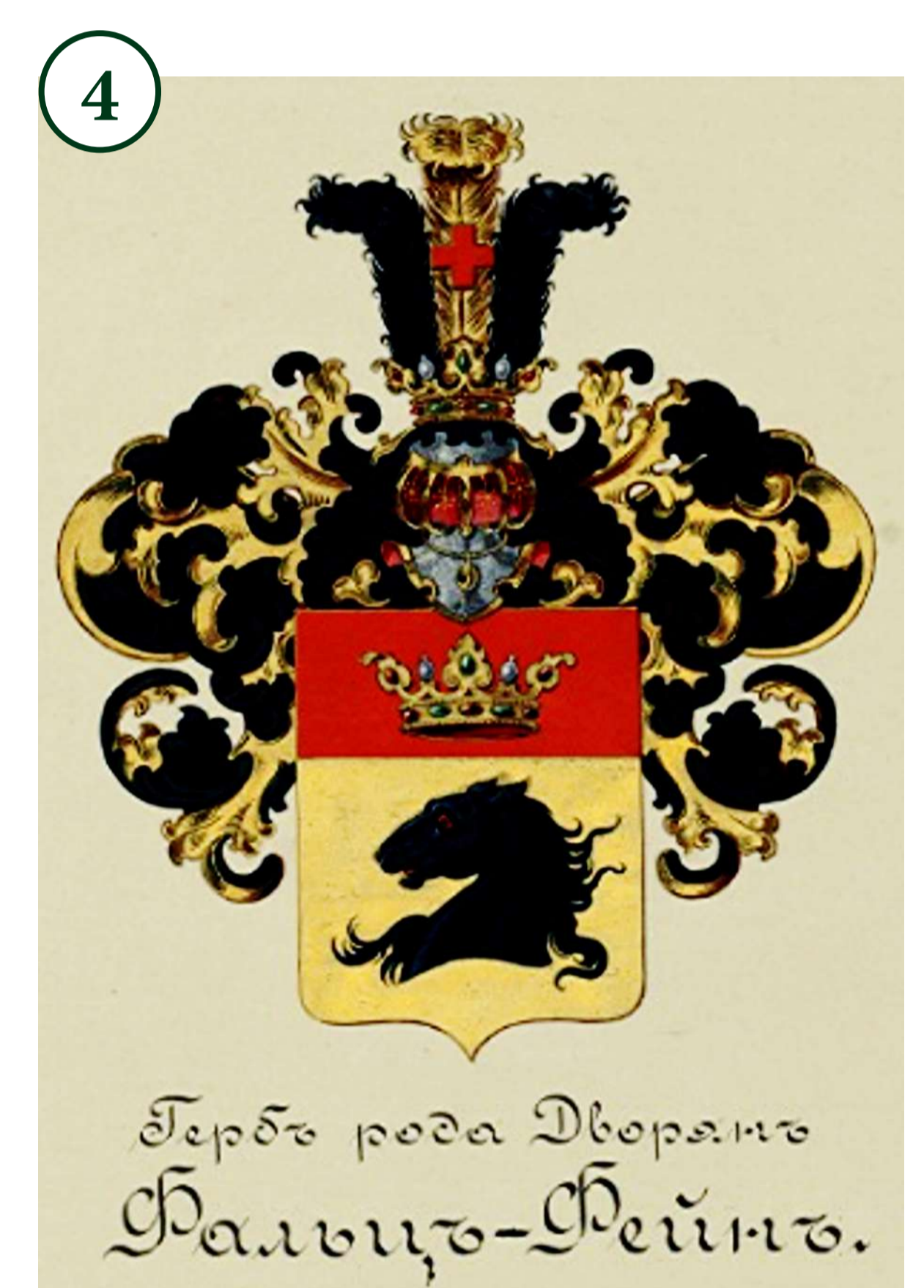
Герб рода Дворян Фальц-Фейн.

„Wunder von Askania“, „Paradies in der Steppe“, „Paradisische Oase“, „Klein-Afrika“... Welch begeisterte Vergleiche und Epithel wählt man nicht alles als Bezeichnung dieses wunderbaren Werks von Natur und Menschen, die einzigartige naturschutzgelagerte Gegend im Süden der Ukraine – Askania Nova!